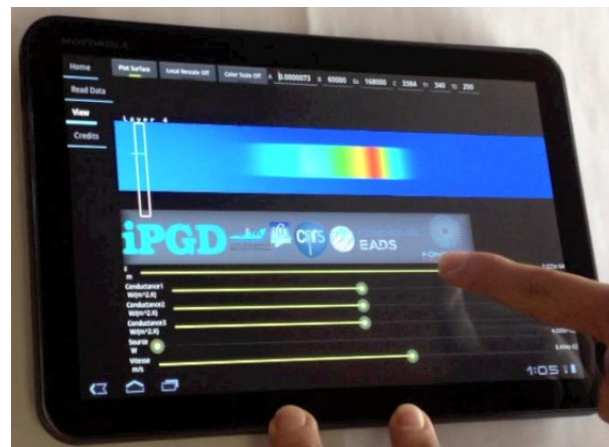
Image: Défis rencontrés dans le cadre de la simulation de procédés de soudage (à gauche) ; et détail d'une table virtuelle, visualisée sur une tablette (droite)

Pour plus d'informations sur l'Ecole Centrale de Nantes, veuillez visiter www.ec-nantes.fr